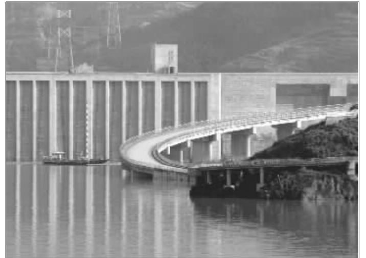
10月5日,清漂船在三峡大坝前清理水上漂浮物。至10月5日,三峡工程试验性蓄水已持续进行8天,三峡水库水位不断抬升。当日17时,三峡大坝坝前水位达155.01米,逼近156米重要水位关口。

元,平均每年增加138元。报告指出,农民收入增长与政策因素、宏观经济及农民自身就业观念等都有很大关系。依靠政策调动农民生产积极性,是促进农民增收的重要因素;国民经济较快增长阶段,也是农民收入增长较快阶段;促进农民就业观念转变,改善农民多渠道就业环境,对保持农民收入持续稳定增长有重要推动作用。