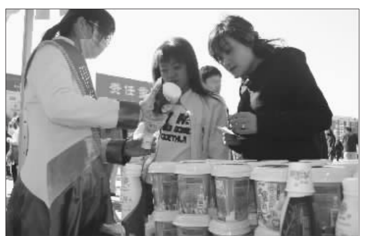
10月5日,呼和浩特市民在活动现场免费品尝乳制品。当日,内蒙古伊利、蒙牛集团在呼和浩特街头举办安全乳制品赠饮品尝活动,旨在逐步树立消费者信心。